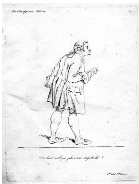
August Iffland als der »Geizige«

die Täuschung der Szene zu gewährleisten, darf zwischen Schauspieler und Rolle keine Distanz erkennbar sein. Ein Schauspieler muß das besonders eindrucksvoll vorgeführt haben, denn er wurde zum Vorbild einer ganzen Generation: Conrad Ekhof. Er war der erste deutsche Schauspieler, der über seinen Tod hinaus faszinierte und dessen Ruhm durch Nachrufe, Gedichte und zahlreiche Erinnerungstexte nicht nur bewahrt, sondern noch gesteigert wurde. 1773 erliegt Friedrich Nicolai dem Schauspieler und hebt an ihm hervor, daß Ekhof in keiner seiner Rollen er selbst sei, sondern »an Stellung, an Bewegung, an Gang, an Mienen, [...] an Gestalt des Gesichts der Mann, den er vorstellt. Es ist unglaublich, bis auf welchen Grad er aus sich selbst herausgehen, sich auch in das Äußerliche des Charakters, den er vorzustellen hat, hinein individualisieren konnte« 33 . Die Glanzrolle Ekhofs war Odoardo