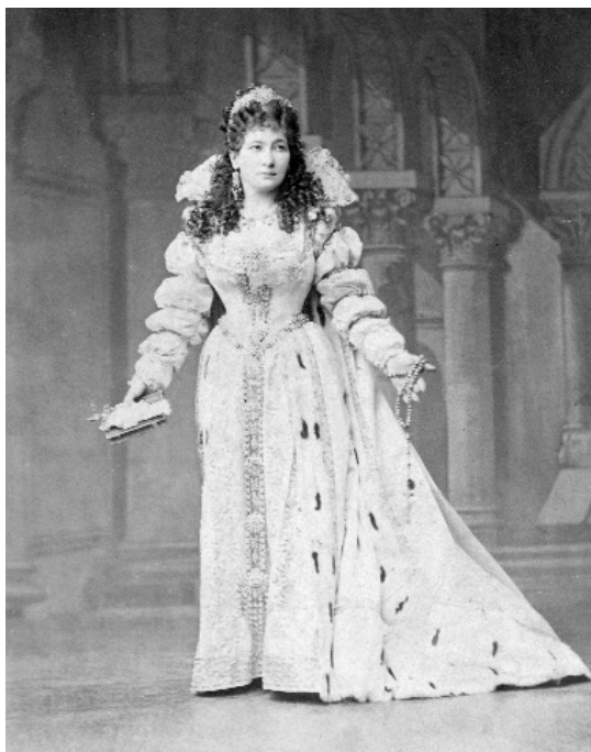
oben: Billet von Charlotte Wolter. Die Briefmarke zeigt das Bildnis der Schauspielerin. (Es handelt sich dabei nicht um ein gültiges Postwertzeichen.) unten: Charlotte Wolter als Maria Stuart.