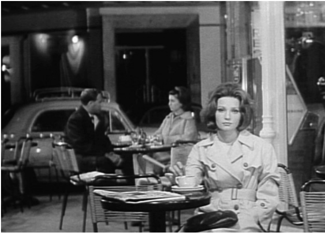
L'Ainé de Ferchaux von Jean-Pierre Melville