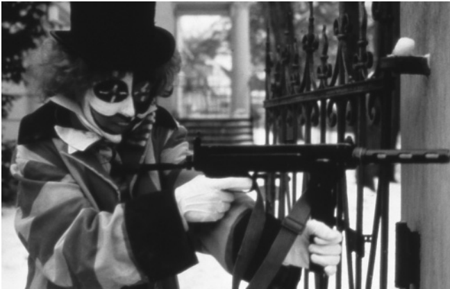
Die dritte Generation von Rainer Werner Fassbinder