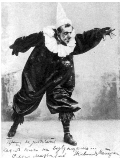
Meyerhold als Landowski in ZIRKUSLEUTE von F. Schönthan, Cherson, 1903