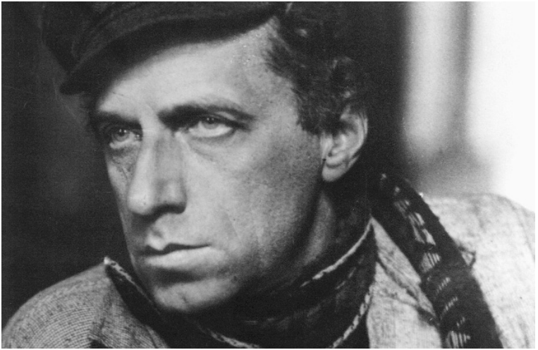
Wsewolod Meyerhold, 1921