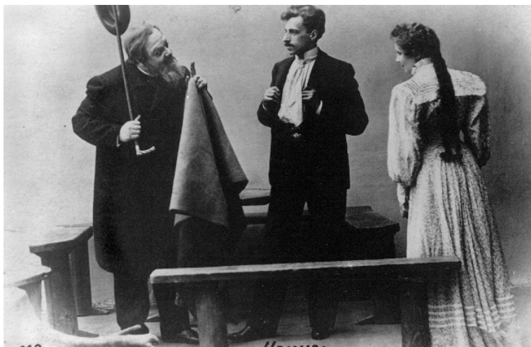
Meyerhold (Mitte) als Konstantin Treplew in Tschechows MÖWE am Moskauer Künstlertheater (MChAT), Moskau, 1898/99